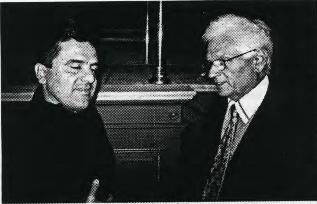
ستوکهولم، ژاک دریدا و نازاد حمده

یاربسه که هموو کس دد توانی بیکا. بویه وک گالتیه پتیکردنیک به دریدا دهلی: قه یسه که جلی نییه چون خـــــــوی له ناو تیوریزه که رانی نه دهب به ده لمه مند پتیشانده!!! مه بهستی سیرل لم پرسیاره نه ویه که دریدا له جیهانی روونا کبیری نه سرودا شتیکی نه وتوی به ره هم نه هیناوه که شایانی لووتبه رزی بی. هه روه ها دهلی نیمه له سرده می زیرینی فلسفه ای زماندا ده ژین. نیمه تنیا له ژیرسایه ی سرده می