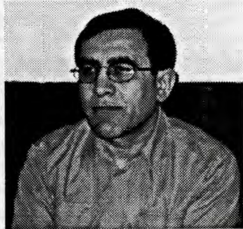
حه مه سه عید هه سن

نهوشیروان بۆ نهو دی ده سته که ی به ته وای نه که ویتته روو، پاییزی ۱۹۸۳ رایسه ارد وریایان تیرۆر کرد و له کۆنفرانسی سیتی کۆمه له یشدا گوتی: «وریان نه پتیبه گانی کۆمه له ی به دۆژمانی ئیمه داوه، نهگه ر زیندوویش