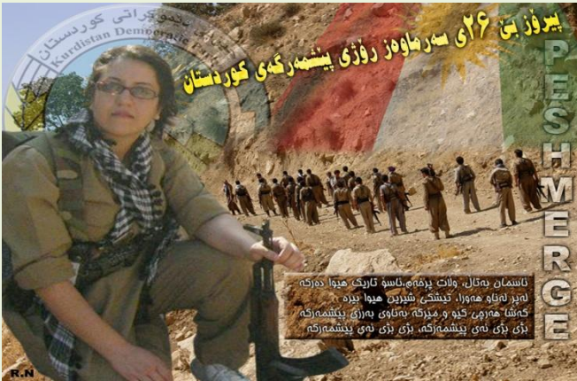
ناسمان به گال، ولاته پره، ناسه تارک هیا دهرک له پهر نه وه، کیشکی شورش هیا نیه که شاره هه، و مژگه به تاره به ماری پینشهرگه زۆری نه یه پینشهرگه، زۆری نه یه پینشهرگه

به ره به ره له گه له ته و او بیون یان که مرنگ بوونه روی بواری خهباتی چه کرداری (به هه ره هویه که وه)، و پیناسه کردنه وه (باز تعریف) ی چه که کانی شورش و شورشگری له نه ده دبایاتی سیاسی جیهان و