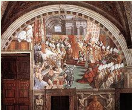
پاپا؛ شارلمان ددخاتە سەر تەخت. تابلۆی رەفائیل، کە دەرگێرتەوه بۆ سەدی شانزەهەمی زاینی.

لەساڵی ٦٨١، ئەنجوومەنی قوستەنتینی سنیەم بەسترا، کە بریاریدا بە ئەقە ئەمدانی مۆنۆسیلیبەتەکی هەرقل بە هەرتەقە [٥٢] و پەسەندکردنی پێشینیاری دووسرووشتی و دوووستی لە بەسووعدا؛ بەلام لە رۆژئاوا باروودۆخەکە ئاماتر بوو، لەگەڵ جیالاکبوونی بزووتنەوه مژگنیدەرەکان لە بلوگرندەوی مەسیحییەتدا لە باکووری فەرەنسا و ئەلمانیا، هەروەها مەسیحییەت گەیشتە نینگلەتەرا و ئیرلەندا لەسەر دەستی پایەبەرز پاتریک [٥٤]. یاشان لەسەدی نۆیەمی زاینیدا مەسیحییەت گەیشتە روسیا، ئەو ماوەیە بە باروودۆخی درووستبوونی وشکەسۆفیگەراییدا رویش و کۆو درووستبوونی وشکەسۆفیگەلی بوندوکتیە و وشکەسۆفیگەلی نۆگەسینیەت کە کاریگەرێکی قوونان لەسەر کۆمەڵگای رۆژئاوایی هەبوو، بەجۆری کە پەرستگاکانی وشکەسۆفییان بەتەنھا بوو بوو زانکۆ و قوتابخانەکانی ئەوروپا، پەرستگای وشکەسۆفی کلۆنی دەستی هەبوو لە ریکخستنی پەیرەوی ناوخی کلیسا و دیاریکردنی دەوری سیکولارەکان تیایدا. کیشەکانی مەسیحییەتی رۆژئاوایی ئەو سەردەمدا خۆی دەبینییەوه لە کارەساتی سرووشتی و هەزاربەگەکی توند کە خەلکی تیایدا دەرژیان لە چوارچۆدی سیستەمی دەریەگی توند دا، ئەمە هاوشانی بلاویونەوی نەخۆتندەواری [٥٥]. هەروەها رەبەراییەتیە بەردەوامەکان کە بوو هۆی روودانی جەنگەکانی نیوان ئیمپراتۆریەتی رۆمانی پیرۆز و پایاکان [٥٦]. ئەمە هاوشانی جەنگی نایکۆنەکان کە ساڵی ٧٢٧