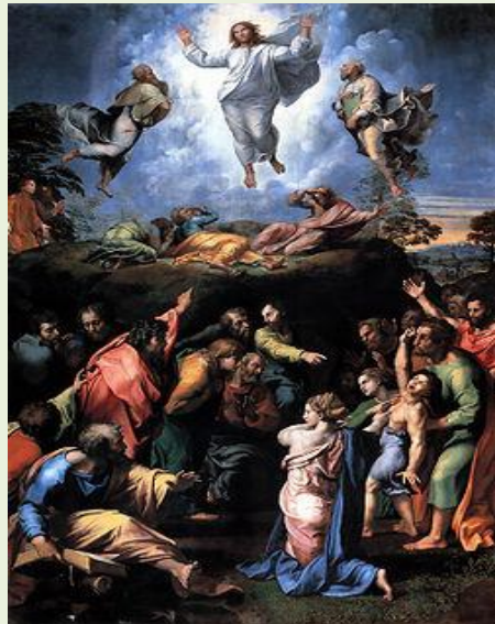
نایکۆنه‌ی شیوگۆرین له‌لایەن رافائیله‌وه‌: به‌وه‌چه‌رخانیکی گه‌وره‌ له‌ میژووی وینه‌کێشاندا له‌سه‌رده‌می رابووندا دادەنرێت.

دەروازه‌یه‌ک بۆ یه‌کخستن و ریکخستنی بیروراکانی نیو مەسیحییه‌ت له‌ژێر رۆشنایی فه‌لسەفه‌دا، بۆیه‌ ته‌نانه‌ت دوومەین ئەنجوومه‌نی قاتیگان له‌ سه‌ده‌ی بیسته‌مه‌دا دانی پێدا نا [۹۰]. تا سه‌ده‌ی یانزەهەمی زاینی پینج ئەنجوومه‌ن به‌ستران، چواریان له‌ لاتران به‌ستران و ناو دەرێن به‌ ئەنجوومه‌نه‌ لاترانییه‌کان، له‌کاتیگدا که‌ پینجه‌میان له‌ کۆنستانس به‌سترا و کۆتایی به‌ لیخترازان پاپایی هینا.