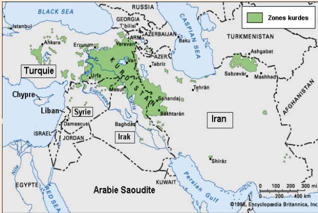
به‌ریانیان و فه‌رنسا‌دا دابه‌شکرا‌ن.

له‌ دوا‌ی شه‌ری یه‌که‌می جی‌هانیه‌وه‌، ولاته‌تی سه‌ره‌که‌وتوی شه‌ر، ئینگلته‌ره‌، فه‌رنسا و ئی‌تالییا، هه‌وئێکی زۆریاندا تا ولاته‌ داگیرک‌راوه‌کانی ژێر ده‌ستی ولاته‌ شکسته‌خوا‌رده‌وه‌کان، واته‌ ئی‌مپه‌راتۆریه‌تی نه‌ئمانی و ئی‌مپه‌راتۆریه‌تی عوسمانی له‌ ناو خۆیاندا دابه‌ش ب‌که‌ن. له‌ کۆنگره‌ی پارێسی-١٩١٩ و له‌ کۆمه‌له‌ی گه‌لان که له‌ ژێر به‌ریاره‌کانی هه‌مان کۆنگره‌دا ب‌یکه‌تا، یه‌کێک له‌ باسه‌ هه‌ره‌ گرێنگه‌کان نه‌وه‌ مه‌سه‌له‌یه‌ بوو. به‌ریاری دانانی مه‌ندوب له‌ سه‌ر ناوچه‌کانی پاشا‌وه‌ی ئی‌مپه‌راتۆری عوسمانی و ئی‌مپه‌راتۆری نه‌ئمانی، یه‌کێک له‌ به‌ریاره‌ گرێنگه‌کانی کۆمه‌له‌ی گه‌لان بوو. سه‌ره‌رای نه‌وه‌ی که (مه‌ندوب) شیا‌وزکی به‌رێوه‌به‌ریه‌، به‌لام له‌ هه‌مان کاتدا ده‌کرێ وەک چۆرێک له‌ داگیرکاری سه‌یر ب‌ک‌ریته‌. له‌سه‌ر خاک و ناوچه‌ جی‌ماوه‌کانی پاشا‌وه‌ی عوسمانی مه‌ندوبی پله‌ یه‌ک (ئ) دامه‌زرێنران، مه‌ندوبی پله‌ی دوو (ب) له‌سه‌ر خاکه‌ داگیرک‌راوه‌کانی ئی‌مپه‌راتۆریه‌تی نه‌ئمانی و له‌ ناوچه‌کانی باشوری ئه‌فریقا‌دا دامه‌زرێنران. هه‌رحه‌ی مه‌ندوبی پله‌ سه‌ (ج) بوو له‌ خاکه‌کانی پاشا‌وه‌ی ئی‌مپه‌راتۆریه‌تی نه‌ئمانی له‌ ناوچه‌کانی باشووری بۆژنا‌وای ئاسیادا سه‌ری هه‌لدا. له‌ چوارچۆبه‌ی مه‌ندوبی پله‌ یه‌که‌کاندا، مه‌ندوبه‌کانی عێراق، ئوردن و فه‌له‌ستینی سه‌ر به‌ به‌ریانیان ب‌نیات نران. مه‌ندوبه‌کانی سه‌ر به‌ فه‌رنسا‌ش بریتی بوون له‌ مه‌ندوبه‌کانی سو‌ریه و لو‌بنان. به‌مه‌چۆ‌ده‌ش ناوچه‌کانی پاشا‌وه‌ی ئی‌مپه‌راتۆریه‌تی عوسمانی له‌ ئێوان دوو ده‌ولته‌تی سه‌ره‌که‌وتو له‌ چه‌نگدا واته‌