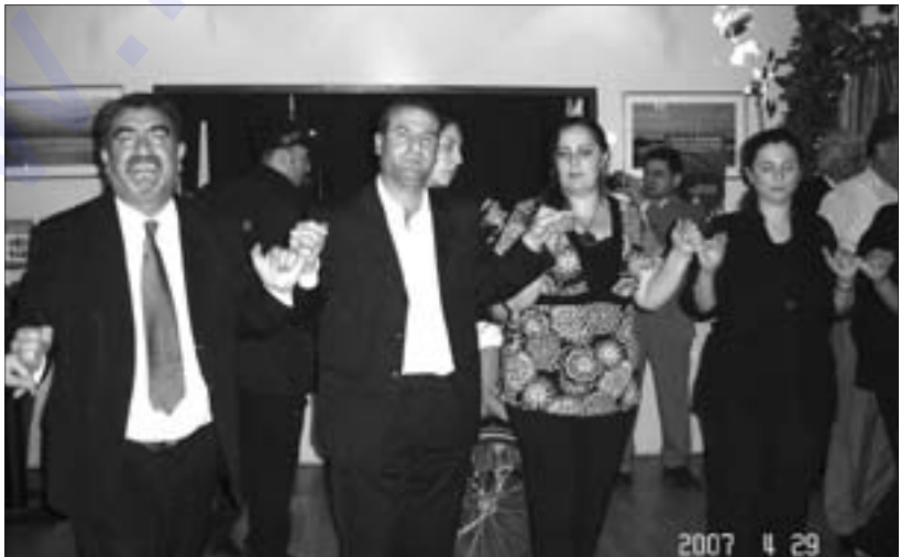
Dîmenek govendê ji şahîya 10-salîya Bîrnebûbê

Bîrnebûn rastiya gelî me ye. Neynêka gelî me ye. Bîrnebûn dîroka „Kurdên Anatoliya Navîn e“. Bîrnebûn di hemêza „Kurdên Anatoliya Navîn“ da ye.