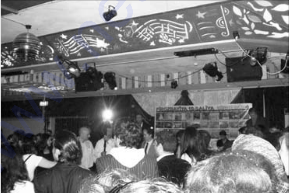
Dîmenek ji şahiya 10-saliya Bîrnebûnê.