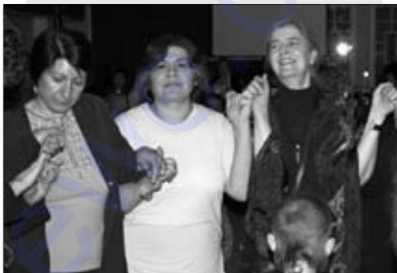
Dîmenek ji şayîya 10-saliya Birnebûnê