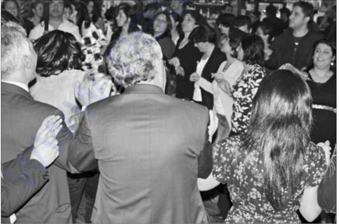
Ji şaiya 10-saliya Birnebûnê, 29 nisan 2007