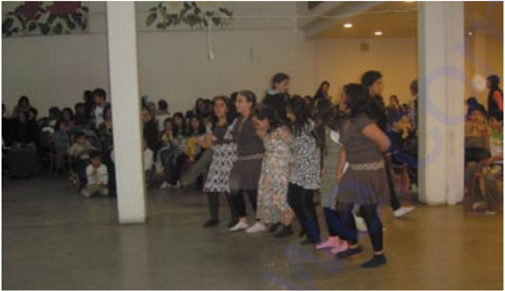
Dîmenek ji şênawiya newroza belediya Botkyrkayê

Li bajarê Stockholmê li belediyeya Botkyrkayê newroza 2007an bi çêşeke mezin hat pîrozkirin.