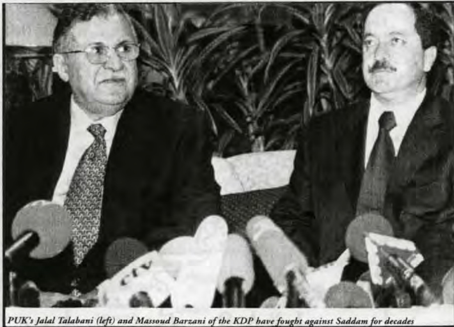
PUK's Jalal Talabani (left) and Massoud Barzani of the KDP have fought against Saddam for decades