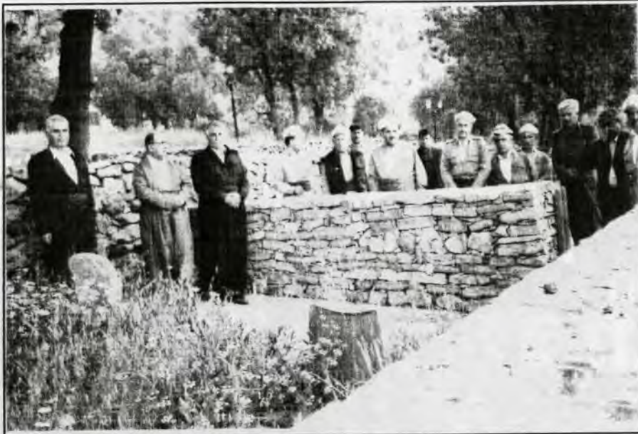
گلکۆی نەمر بارزانی لە شارۆچکەی بارزان: برادەڕانی پارتی، ر. پێشناماز، ج. گادانی، ح. رەستگار

● بە تیکرایی و مزعی ژبانی خەڵکت لە هەردوو کە بەشی کوردستان چۆن ھاتە بەرچاوی؟