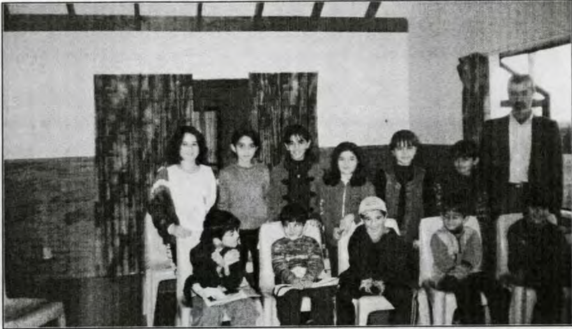
کاتی خوتیندی وانەى کوردی له گهرهکێکی نۆکلەند

ههیه. ولاتیکی فره نهتهویه و نزیکهى ۲۲ نهتهوهى تیدا دهژین که خاوهنى دیمۆکراسیهکی تهواوه و ههموو بېر و بۆچوونتیکی سیاسیی نازاده، به هیچ شتویهک جیاوازی له مابهینی نهتهوهکاندا نابینرێ. نیوزلاند نۆ شاری گهروهی ههیه و، سهرحهمی نفووسی ئه و ولاته ۳,۶۰۰,۰۰۰ کهسه که لهوانه ۷۴,۵٪ ئهروپیی به، ۱۲,۹٪ ماوری به، ۵٪ دوروگهکانی دهووبهرن و ۷,۶٪ خهلکی ئاسیان. سالا نه ۷۵۰ پهنا بهر بۆ ئه و ولاته به پێده کهن، به تایبهتی ئه و پهنا بهرانهی که له ژێر سایهى UN دان، یه کهم رۆژ که پانا بهر دیتته ئێره، پیتاوی ماندووبوونی دوروودریژی له ئوردوگا داده که تیت. به پتی یاسا هه ر پهنا بهر تیک ده بی ماوهی ۲۰ تا ۴۰ رۆژ له که مپ بمینیتته وه، تاکوو یاسا کانی نا و ولات به تهواوی فیر بیت. یان نه گه ر نه خۆ شیهی که هه بیت چاره سه ری بکه ن. ههروه ها ده بی هه ولی فیربوونی زمانی ئینگلیزی بدات. له نا و که مپ که دا چه ند دایره ی ره سمی ده بیندری. وه ک دایره ی هه جره (کوچکردن)، دایره ی خزمه تکردنی په نا به ران و نه خۆ شخانه .. دایره ی هه جره (کوچکردن): ئیش و کاره ره سمیه کانی له نه ستۆ دا به و رۆژانه ش قسه که رتکی دایره که باسی یاسا کانی ولات بۆ په نا به ره کان ده کات. دایره ی خزمه تکردنی په نا به ران: ته ر خانگرا وه بۆ پیتا و یستیه کانی جلویه رگ و خانوو کرتن و جتبه جتیکردنی یارمه تی هه فتانه ی په نا به ر له ده ره وه ی که مپ و هه ندی یارمه تی تر.