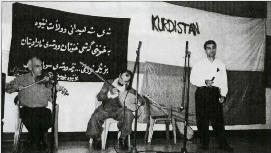
کاتی پیشکەشکردنی لاواندەوێهێکی کوردی بۆ شەهیدانی هەلبەجە

ریکخستنی یەکیێتی نیشتمانی کوردستان، ریکخستنی پارێزگاری دیموکراتی کوردستان، دۆست و لایەنگرانی حیزبی دیموکراتی کوردستان و، کۆمەڵەی خۆتێندکارانی کورد. لە هەمان کاتدا هیچ کێڕوگەفتیک لە مابەینماندا نییە. هەموومان بە دەنگ بانگەوازی یەکتەرەوه دەچین و خۆشەویستیەکی تەواو لە ناوماندا رەگی داکوێتەوه.