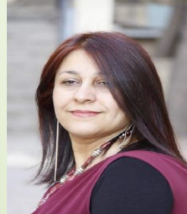
خاتوو میدیا رهئوف بێگهرد شانۆکار

پێرفۆرمانسی سۆراخی رۆحیکی وون له میانهی پرۆزه ( ههر پرۆزه زینیک )