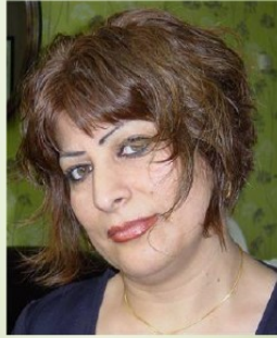
خاتوو دلسۆز همه