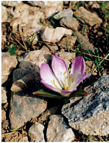
Merendera kurdica , colchicum kurdica , kulîlka cotarî, hanhanek, ciwanemerg, pîvok