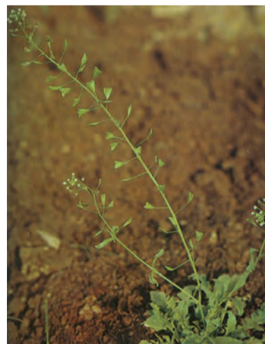
Capsella bursa pastoris , kisike shivani, turike shivanan, tarek (zaza)