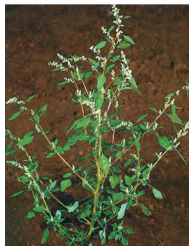
Chenopodium album , selmast, selmask, selmik, vilincê bizan (zaza)