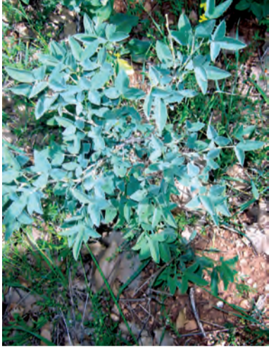
Anagyris foetida , kerat, qereqac