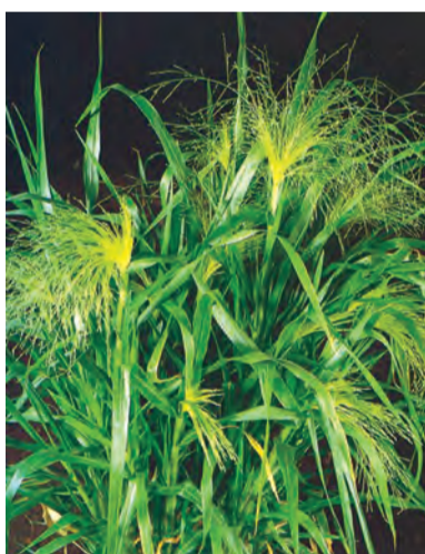
Panicum capillare , sorik, korek