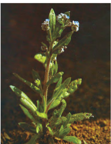
Myosotis arvensis , guriz, gelziwan, gûriz, gwîriz