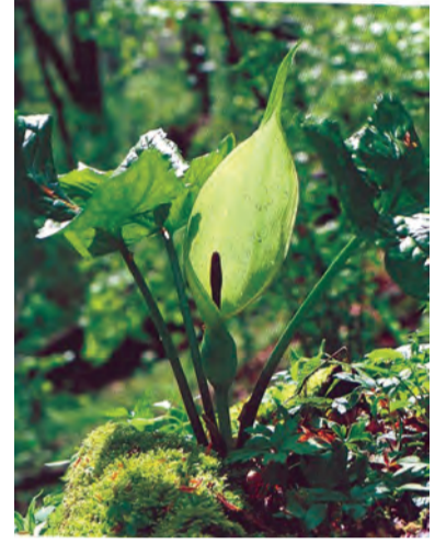
Arum maculatum , kari, kardi, kardû, marmaroshk