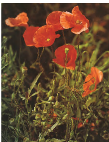
Papaver rhoea , bûkîk, bûkanî, bûk, bwîk, nîsanok, patpatok, patpatole, bûkûzava, gulênîsan, rêywek