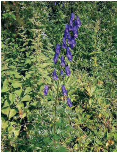
Aconitum napellus , gurxeneq, kerxeneq