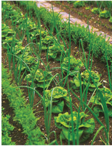
Brassica oleracea , kelem