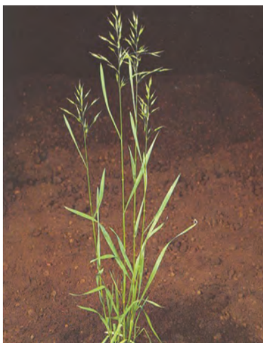
Bromus spp , shirk, giyagenim, biragenim, xelvas (zaza), shilmok