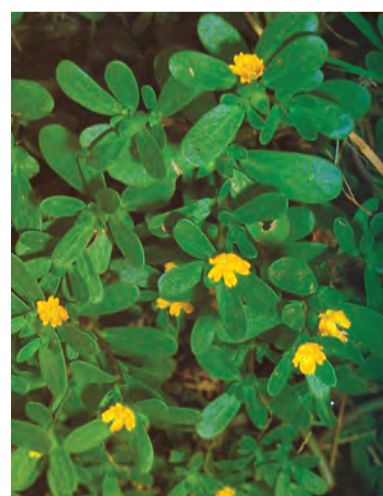
Portulaca oleracea , pirpar, parpar, pêpîne