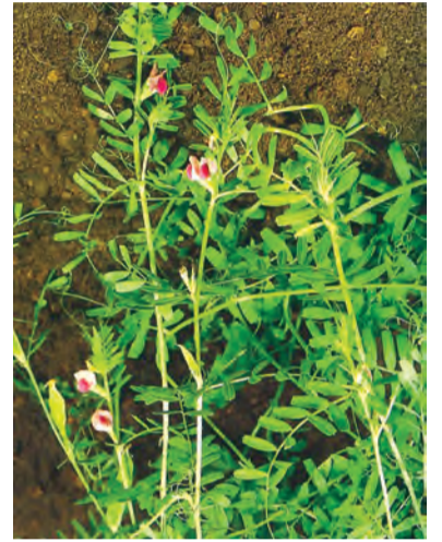
Lathyrus tuberosus , colbenî, şolikê maran, baqilê maran, kelîmar