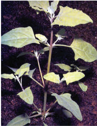
Atriplex hastata , kerbalcana beji