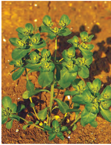
Euphorbia helioscopia , xweşîl, taleşîr, şîrmar, xagşîr, xwelîşîrik, şîrik, şîroke, delêk (zaza)