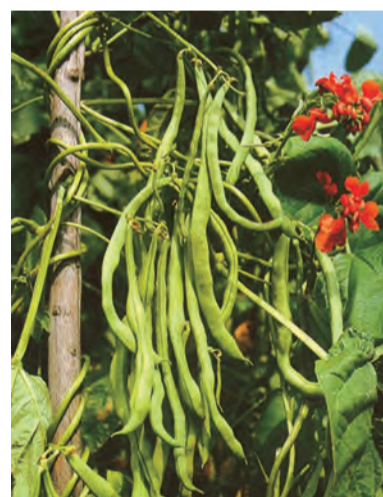
Phaseolus vulgaris , fasûlî, fasûlye, fasolî, fasla (zaza)