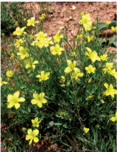
Linum , kitan, kitaf, guş