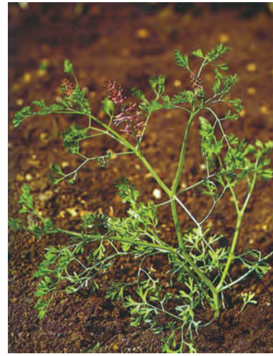
Fumaria officinalis , şahtere