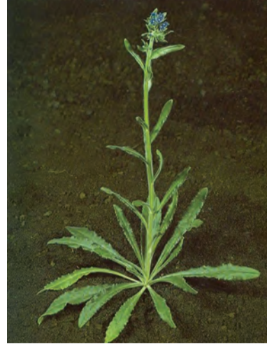
Anchusa officinalis , guriz, gelziwan (zaza), gurisk