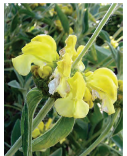
Phlomis grandiflora , guhbelok