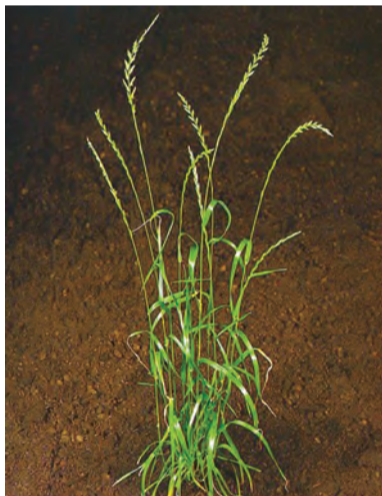
Lolium temulentum , çîm, giyareş