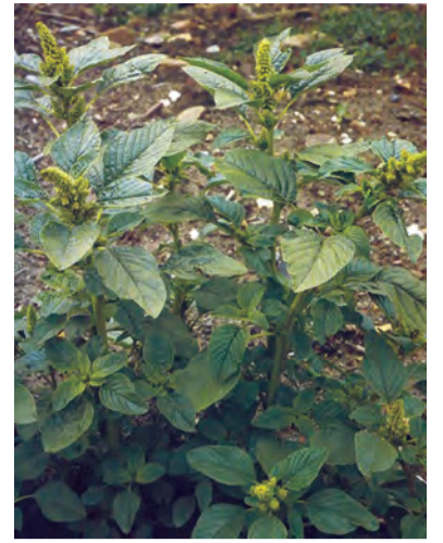
Amaranthus retroflexus , koksor, luehandir (zaza)