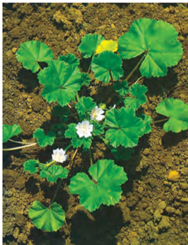
Malva neglecta , tolik, xamazek (zaza)