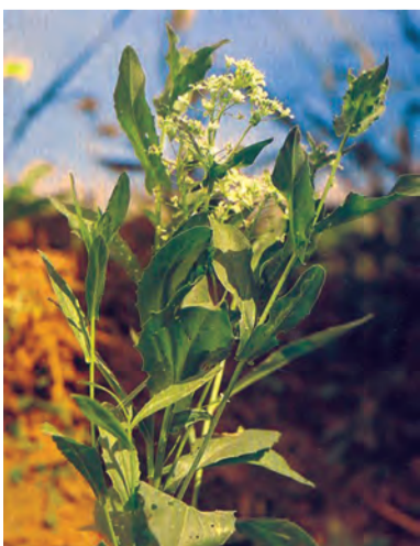
Cardaria draba , qineber