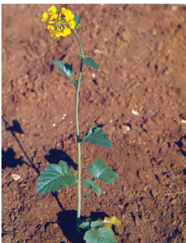
Brassica nigra , xerdela beji, xerdela res