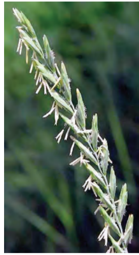
Agropyron repens , firez (li hin deveran)