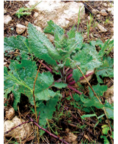
Boraginaceae , kevlepîr