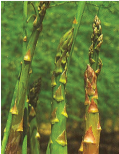
Asparagus officinalis , meroje, merje, mirajo