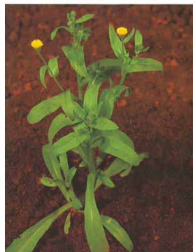
Calendula arvensis , gula çavêşe, hemîşe bihar