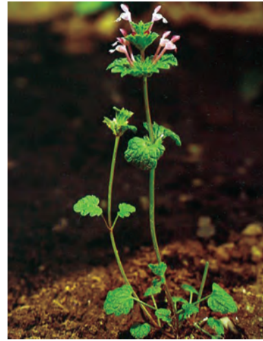
Lamium spp. , hingivîn, mijmijok, vaşê mêşan (zaza)