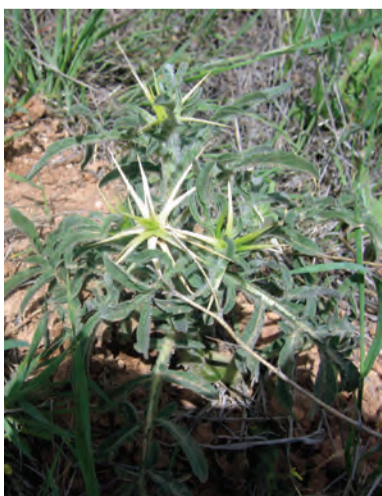
Centaurea , stribelok, strishujin, striye çavbiloq, çavbiloq