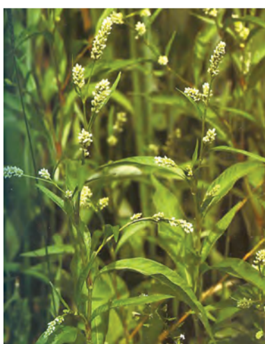
Polygonum lapathifolium , qirşsorik