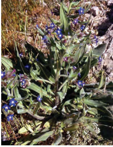
Anchusa azurea kurdica , guriz, gormize, zimanê ga