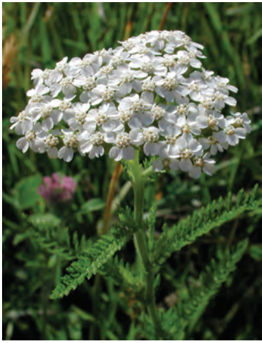
Achillea millefolium , bawijan, pujan, gulike maran