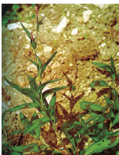
Polygonum persicaria , mastêrk, sinbêleşên (zaza)