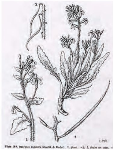
Hesperis kurdica , qaçmûk, şewbor