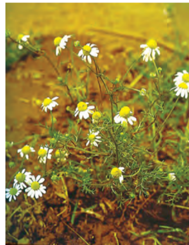
Matricaria chamomilla , beybûn, beybûna demanan, babûnc