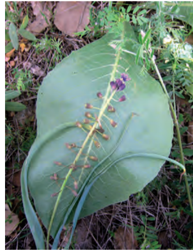
Bellevia , geleqir