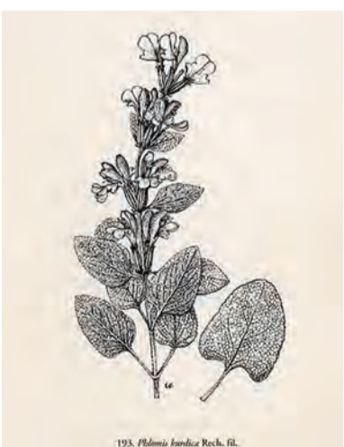
Phlomis kurdica , sîvanok