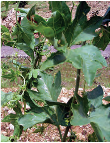
Hedera helix , dargerînk, daralînk, badar