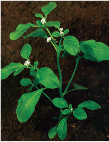
Heliotropium europaeum , giyagewrik, kifkedûpişk, giyadûpişk, vaşogewr (zaza)