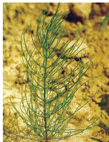
Equisetum arvense , duvike hespe, sipinge maran, singe maran, shitlê xezalan, tiliper, runin (zaza), vashbitri (zaza)