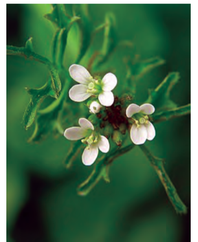
Cardamine hirsuta , bendika avi, vizdorik (zaza)