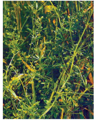
Gallium aparine , zimaxwînk, zeliqok, nûsek, nwîsek, padûseh (zaza), dûgune