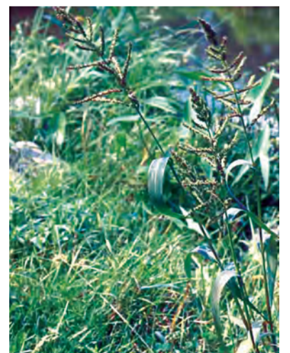
Echinochloa crusgalli , darucan, sherpug