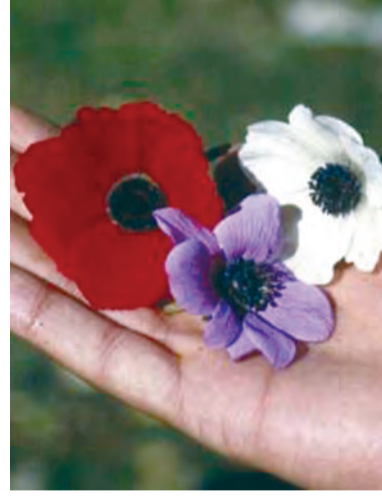
Anemone coronaria , adarok, gualesure, kurikmast