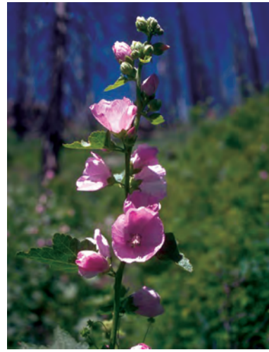
Alcea kurdica , hero