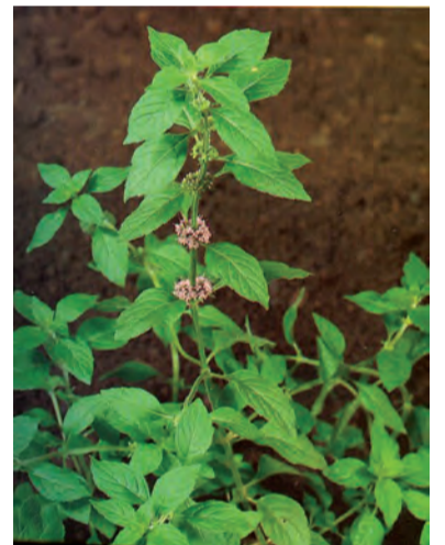
Mentha arvensis , pûjan, naneya bejî