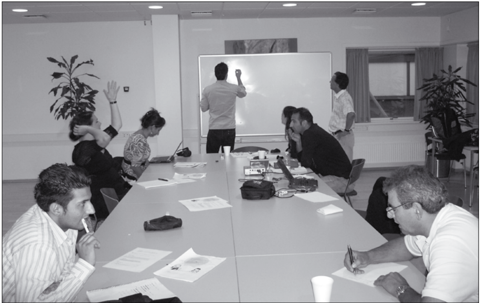
Dîmenek ji kursa zimanê kurdî li Danmarkê

zimanê dengkirinê de kê mên bi karanîn an jî nayên bikaranîn em hîn bûn. Ez êdi dikarim bi kurdî pirtûkan bixwînim û xwe bi pêş bixim.