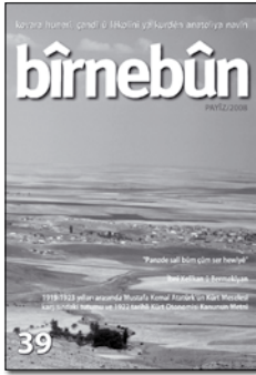
Wêneya li berga pêşîn: Baxçê Eysê û gündê Bêşqewaxê