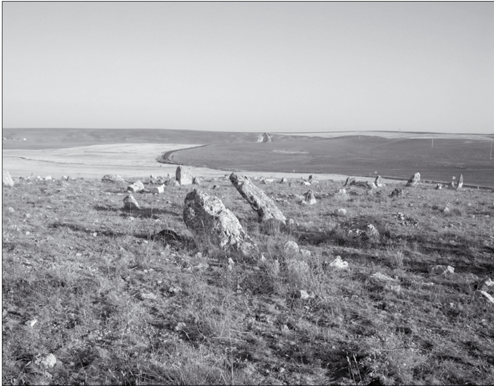
Dîmenek ji deşta Susizê, kevir û kêlên Mezelê Susizê

Ev navçeyê di vê dîmenê de "Susizê" ye. Xelkên navçe welê bi nav dikin. "Susiz" bi tirkî tê maneya "bêav". Navçeyekî bê av e. Û ev kevir û kêlên di wêne de jî mezelek e. "Mezelê Susizê" dibêjinê, li ser devê rêya gundê Hecîlera û gundê Kelhesen e.