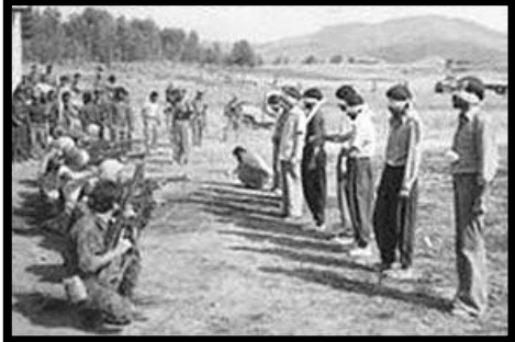
به‌شی پینجه‌م نوسینی: هۆمه‌ر