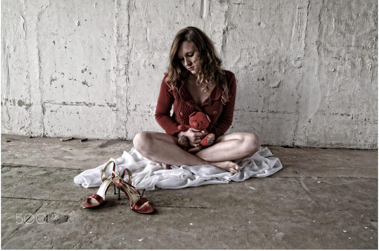
📷 Cuvelier Jean-Charles