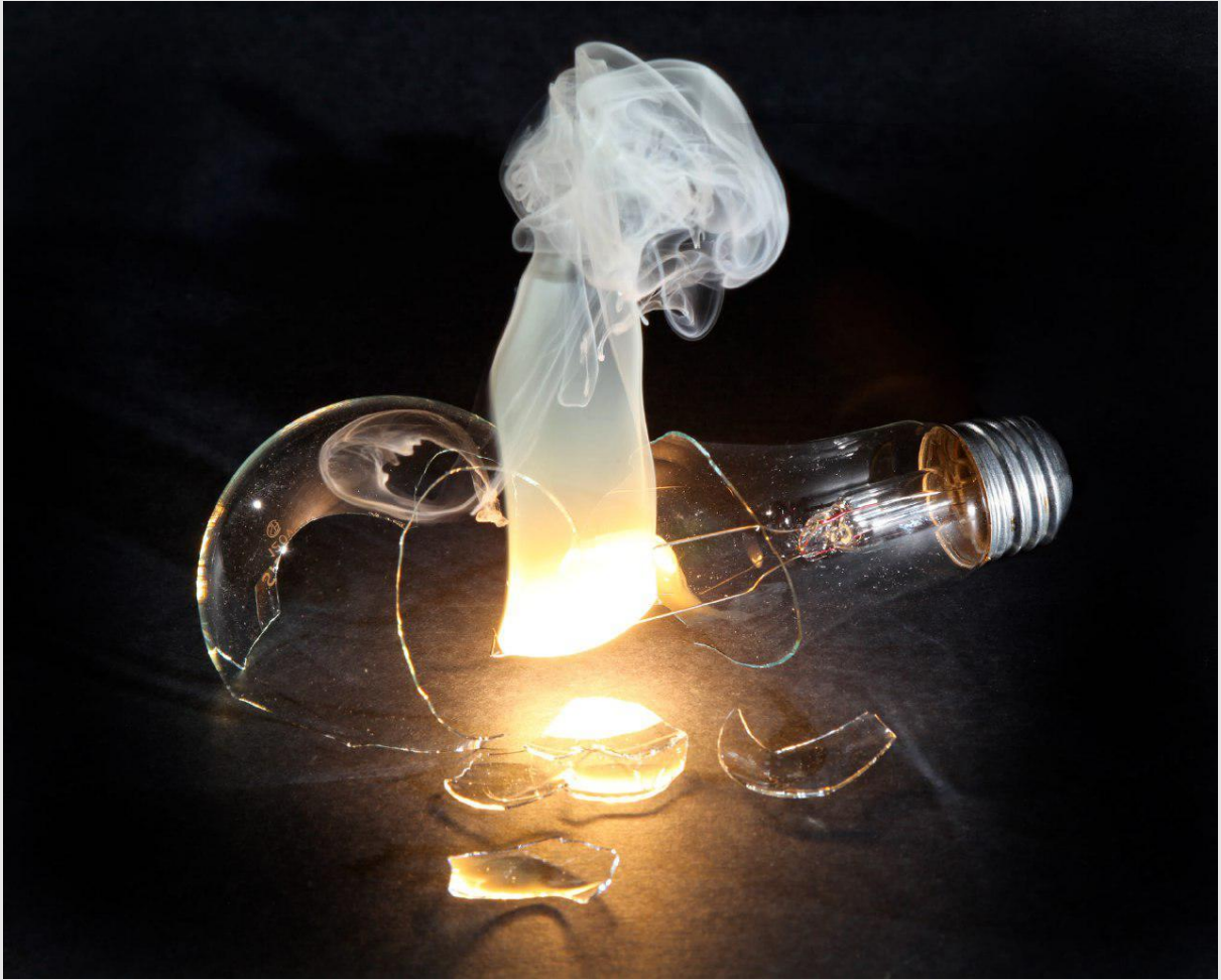
📷 Robert Och