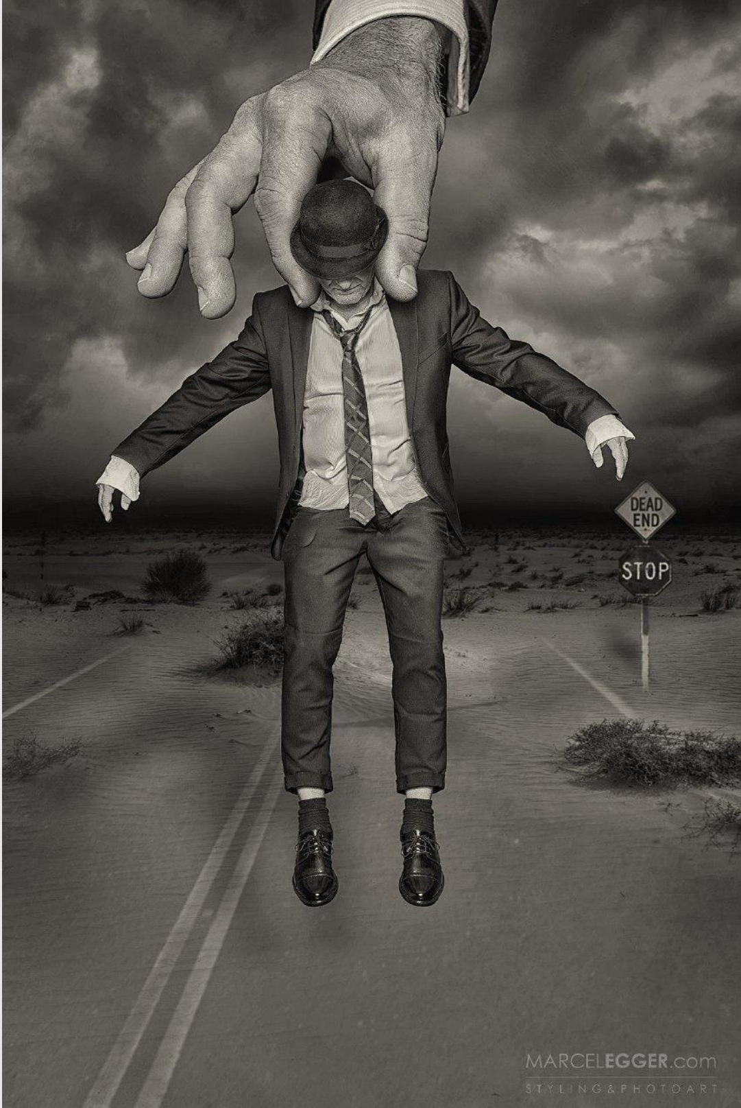
📷 Marcel Egger