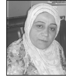
سهبا ههله بجهیی