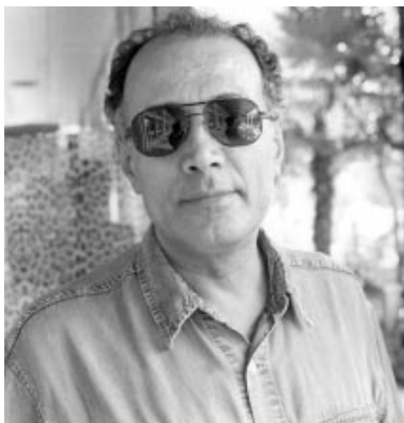
عەباس کيارۆسته می

ژیانی تایبەتی مەرۆقی کورد، پیتوهندییە کۆمەڵناسانەکانی گوندی کوردستان و ژنی کورد و مندالی کورد سەرەکیترین بابەتی ناماژە پیکراوی فیلمەکن. لێرەدا کيارۆسته می بە شیتوویەکی زۆر شاعیرانە بۆ کوردستان دەروانی و ئەووی وا پیشانی دەدات بە تەواوی لە شیعەر دەچیت. پەیداکردنی جوانترین و گونجاوترین سووچەکانی دانانی کامبیرا، نیشاندانی جوانترین دیمەنەکانی گوند و روانینی نەرم و نیان لە خانووکان و کۆڵانەکان، یەكسەر بە زمانی شاعیرانە، کراوەتە فیلم.