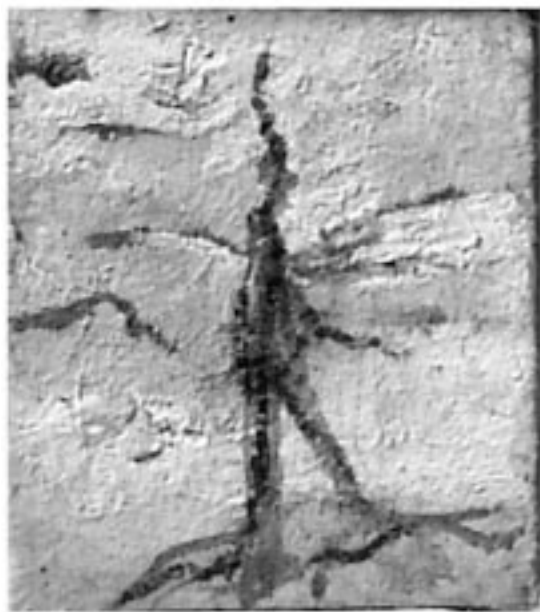
تابلۆی هونه رمه ند «ناری بابان» (۱سم × ۹مم) - ناوی

دوه میشیان زیدی له دایک بوونی (پاتک) ی باوکی مانیه که له هه مه دان له دایک بووه و په روهرده و گه وره بووه تا ساڵی (۲۰۷) زاینی تیداما وه ته وه له ویش ژنی هیناوه شاری ئە کبادانیش (هه مه دان) مه لبه ندیکی کوردنشین و (قه لای به هار) ی نزیک ئەو شاره ش له به ری باکووری خۆرئاوای به وته ی میژوونوسی ئیرانی (حه مه دولا ئەلمسته وفی ئەلقه زوینی) نه ک هه ر ئەو سه ره ده مه ی پاتک-ی باوکی مانی له وێ له دایک بووه و ژباوه و ژنی هیناوه که تا سالانی دووسه دی زاینی ده کات، به لکو تا ناوه راستی سه ده دی چواره می زاینی پایته ختی ولاتی کوردان بووه که له شازده هه ریم پیکه هاتوه. بۆ زیاتر زانیاری پروانه [نزّه القلوب، باه تمام و تصحیح: گای لسترانج، بکوش: محمد دبیر