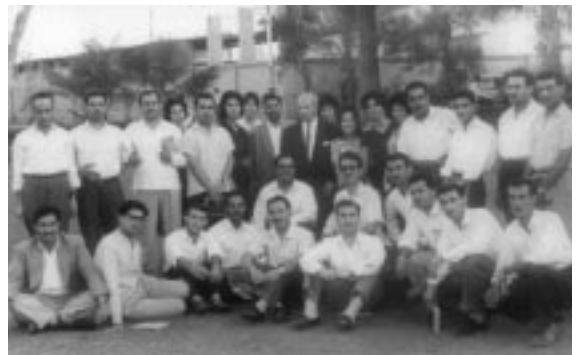
قوتابیانی به شی عه ره بی کۆلیژی پهروه ده - ۱۹۶۱ به غدا دانیشتوونی ریزی یه که م له چه په وه بو راست که سی سیپه م (له تیف حامید). دانیشتوونی ریزی دووم له راسته وه بو چه پ که سی یه که م (که مال غه مبار)

به ستر او ده ته وه و بو ته دوو تبۆر، یه کیکیان ناو ده نرئ (سیحری) سه یری شیعر ده کات به و سیفه ته ی حه قیقه تیکی ئیستیاتیکی جوانکاری خودیی سه ره خۆیه له واقع و دووه میان (ئورفیوسی) یه. له م روانگه یه وه ده بی به راوردئ له نیوان (زمان) و (زمان) بکه یین، زبان ئامرازی ئاخواتنه، زمان ئامرازیکی ئه ده بییه، زمانیکی سیحری ئیستیاتیکییه، هیز و پیزی ئه م جو ره زمانه ش به ندن به چۆنیه تی و شیوازی دارشتن، به تاییه تی له ده قی شیعر دا چۆن ریتمی ناوه وه، ده ره وه ی شیعر ده خولقیته؟ به چ شیوازیکی روونیژی هاوچه رخ به کار ده یترئ، نه ک شیوه لاسایی که ره وه که ی، چ جو ره ته ری و پاراوییه ک ده به خشی؟ هه ر بو به ره خنه ی نوئ لایه کی ته واو له زمان ده کاته وه، که ده لئیی زمانی ئه ده بی، واته زمانی داهیتان و ئه فراندن نه ک زمانی بازاری رووت.