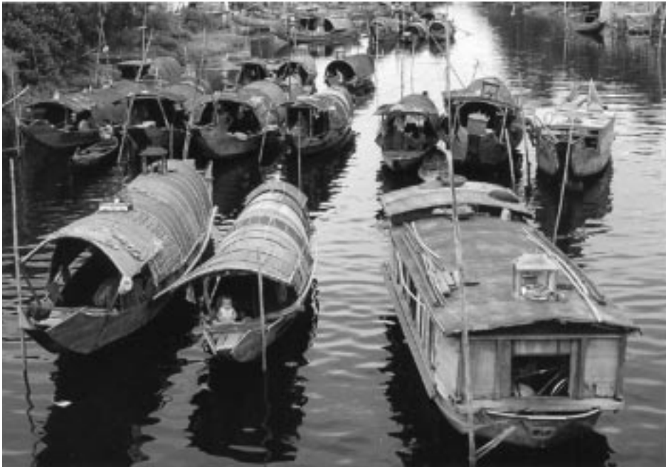
ژيان و گوزهرانی ځيټنامييه کان