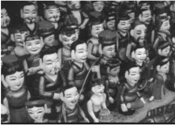
کاره‌کنه ناسراوه‌کانی شانۆی بووکه‌شووشی ناو