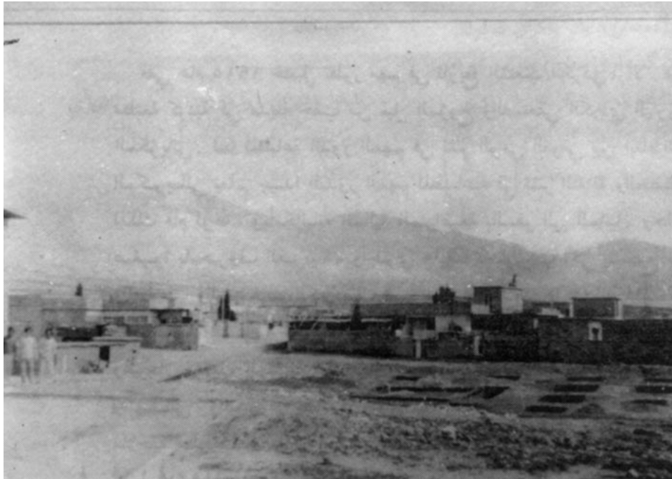
دیمینکی شاری سلیمانی، وینه که له سالی ۱۹۱۳-دا گیراوه.

سه‌رژمیتری شاری سلیمانی به‌هۆی ئەوه‌وه به‌ده‌ست بهینم، واته ئەوه‌ی له‌و سه‌رده‌مه‌دا له‌به‌رده‌ست‌مدا بوون هه‌ر ئەو سه‌رژمیتری شاری سلیمانییه که تا سالی ۱۹۸۶ بووه له‌ لایه‌ن حکومه‌ته یه‌ک له‌ دوا‌ی یه‌که‌کانه‌وه به‌ په‌رسمی کرایه‌ت، بۆیه ه‌ی س‌اله‌کانی دواتر نازانین، چونکه دوا‌ی سالی ۱۹۸۶ و دواتر ئی‌تر ر‌اپه‌رین به‌رپا بوو و له‌وسا‌که‌وه‌ش تا ئەم‌پۆ سه‌رژمیتریکی دیکه نه‌کراوه تا ئەو ژماره نوێیه‌ی دانیش‌توانی شاری سلیمانی بن‌وسین.