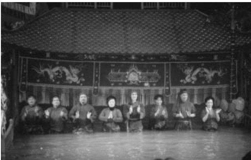
ئەکتەرەکانی شانۆی بووکەشووشە ناو

ئەمڕۆ گۆری سیزەرەکان لەم شارەدا بایەختی ئیجگار گەورەییە و سالانە لە شارەکانی تری قیتنام و ولاتانی دنیاوہەزاران کەس ڕووی تیدەکەن. لە ساڵی ۱۹۹۲وہ ئەم شارە لەلایەن ئۆرگانی یونسکووە وەک شاریکی کولتوووری جیھانی ناوزەد کراوە. لەم شارەدا ناوچەییەکی گەورە لە بەشی لای چەپی ڕووباری بۆنخۆش بەناوی (سیتا دیتل)وہ ھەییە، ئەم ناوچەییە نزیکەیی دە کیلۆمەتر درێژە و لە ساڵی ۱۸۰۴دا دروست کراوە. لەم ناوچەییەدا گەلیک پاشماوہی دیریکی بەنرخ لە کۆشک،