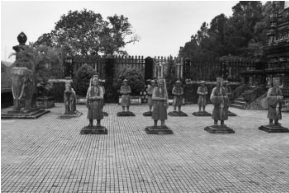
گۆره پانی گۆره پادشاییه کانی شاری هه رویتین

شیوازیکی شانۆیی تریش هه یه و زیاتر به شانۆی قسه، یان گفتوگۆ ناوزهد کراوه (کیس نوۆی)، ره گوریشهی ئەم شانۆیهش دهگه رپتهوه بۆ شانۆی رۆژئاوا و شانیه شانی شانۆی مۆدیرنی قییتنامی له بیسته کانی هه زاره ی رابردوودا سه ری هه لداوه. ئەم شانۆیه ره واجیکی زۆری له نیوان قوتاییان و رۆشنیبه کاندای هه یه.