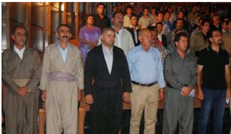
Rawestana li ser piyan ya beşdarên rêûresmê di dema xwendina sirûda neteweyî ya Ey Reqîb de