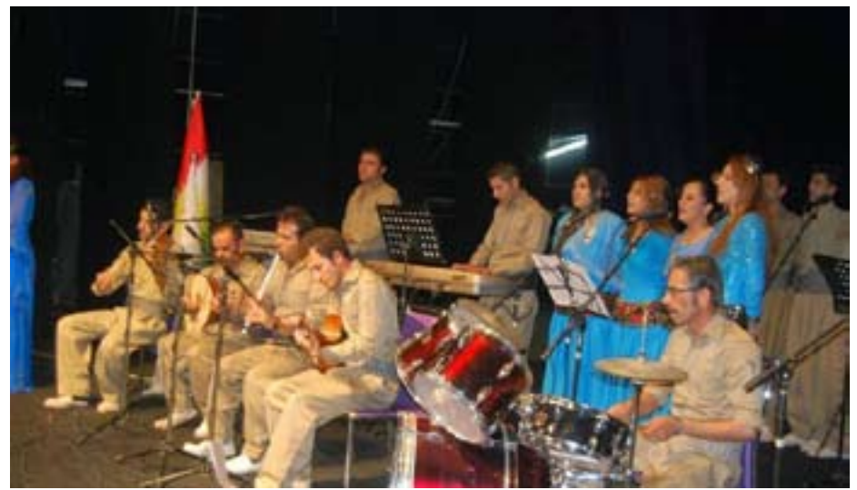
Kora muzîkê ya PDKÎ di dema xwendina sirûdên şoreşgerî taybet bi salvegera şehîdkirina Dr. Qasimlo