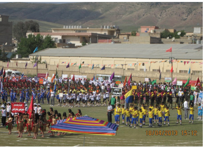
کۆمه‌لگای قوتابخانه‌ی بنه‌ره‌تی «رۆژه‌لات» به‌شداریان له‌ رێژی سالا‌نی قوتابخانه‌کانی هه‌رمێ کوردستان دا کرد.

8 نێزایمی کۆماری ئیسلامی و سیستمی کۆماری