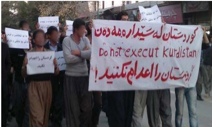
دیبه‌نیگ له‌ ئاره‌زه‌ی تیبی خه‌لکی مه‌روبان دژئ ئه‌عدام (ره‌زه‌به‌ر)