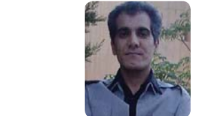
ئارمەش لۆرستانی وه‌رگیران بۆ كوردی: ئالمه‌شین

به‌ هیوای سه‌ر‌كه‌وتن حیزبی دیموکراتی كوردستان ده‌فته‌ری سیاسي ریه‌بندانی ١٣٩٢ه‌تای