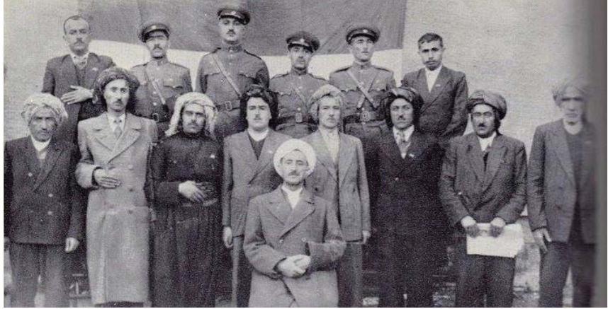
ه‌ه‌ل‌گ‌رت‌نی ئە‌س‌ل‌ه‌ه‌ له ن‌ی‌و ش‌ار‌دا غ‌ه‌ی‌ری ئە‌ش‌خ‌اص‌ی م‌ع‌ج‌از بە ک‌لی ق‌ه‌د‌ه‌غ‌یه ه‌ه‌ر ک‌س‌یک له ن‌ی‌و ش‌ار‌دا ت‌ی‌ر خ‌الی ب‌کا س‌خ‌ت

ب‌ه‌و‌ی ئە‌وه‌ ن‌وس‌را‌وه‌ له‌س‌ه‌ر ق‌ه‌ر‌اری