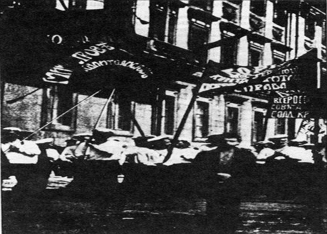
Kronstadt sailors demonstrate for the power of the soviets, 1917.