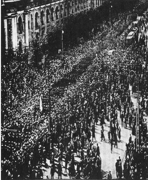
Cossacks in the Nevski Prospekt guardedly watch a demonstration of soldiers and Kronstadt sailors in July, 1917.