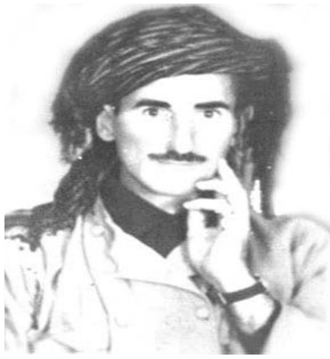
حه سه نه خو شئ