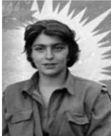
زيلان په پووله