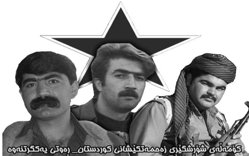
جه ميل خه يات