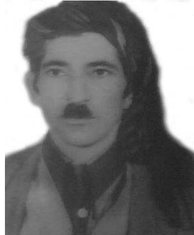
مه لا محه مه د جه وانرودي