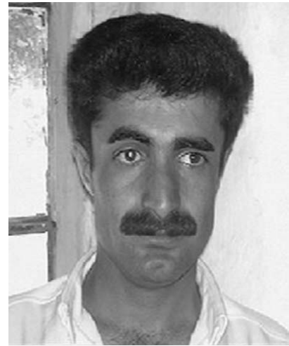
ئه بوبه کر دیه وه ند