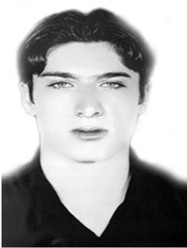
وریا محه مه دیان