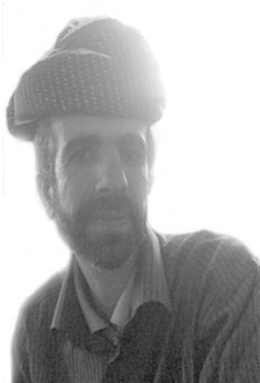
که‌ریم کۆنه پۆشی