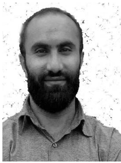
سه‌عدی مه‌لا مسه‌فا