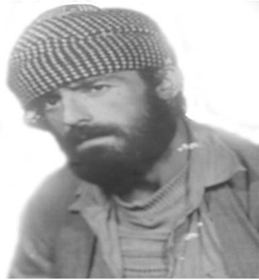
مه لا حسه يني نئ