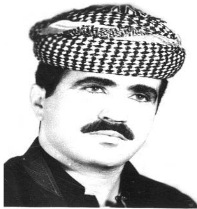
مه لا ئه سه ده و له ژير