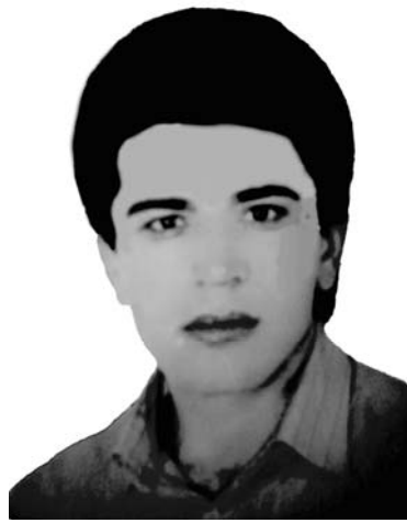
حه مه ی ئه له